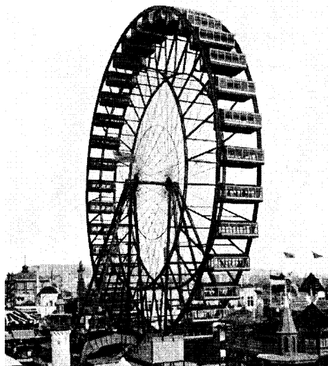
シカゴ万博の巨大観覧車

B 技術は人類を豊かにする一方で、⑤ 戦争 や国威発揚にも用いられてきた。とりわけ、19世紀後半になると欧米諸国は、万国博覧会などにおいて自国の科学・技術を誇示するようになった。1889年のパリ万博で登場したエッフェル塔は、⑥ フランス の鉄鋼生産力や建築技術の高さの象徴であった。4年後にアメリカ合衆国で開催されたシカゴ万博では、⑦ アメリカの技術発展 の成果が展示されたほか、パリ万博に対抗し巨大観覧車が設営された(下図参照)。科学・技術により国の威信を誇示する傾向は第二次世界大戦後も強まり、⑧ 核開発 や 宇宙開発 もその手段の一つとなった。